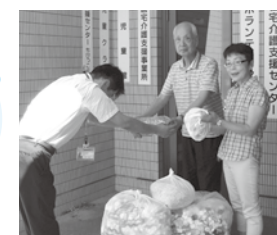
7月21日(金) 福井県年金受給者協会松岡支部様より、エコキャップ、プルタブを頂きました。