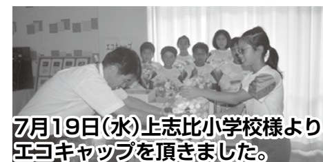
7月19日(水)上志比小学校様より、エコキャップを頂きました。