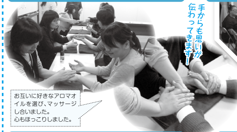
手からも思いが 伝わってきます