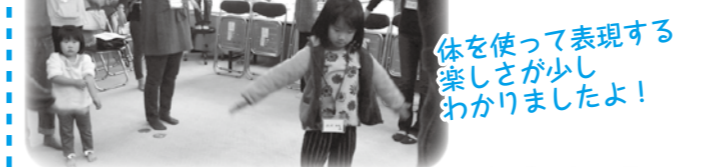
体を使って表現する楽しさが少しわかりましたよ!

自分の名前を手話で表現しました。手話の動きを入れたラジオ体操を楽しく行いました。