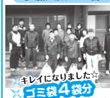
キレイになりました☆ ゴミ袋4袋分