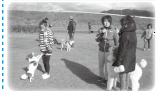
ペットのことで悩んでいることを相談し、いろいろな教えをもらいました。