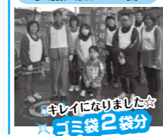
キレイになりました☆ ゴミ袋2袋分