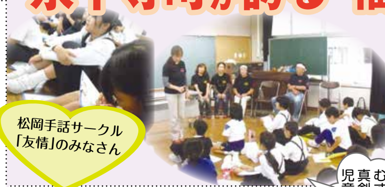
松岡手話サークル「友情」のみなさん