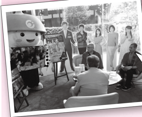
石川県まで、えい坊くんと一緒にPRしてきました!