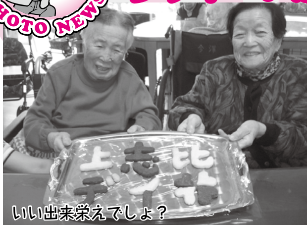
いい出来栄えでしょ?

デイサービスセンターではさまざまなレクリエーションを行っておりますが・・・、みなさん食べ物には目がないようです(笑)。今回はクッキーづくりに挑戦! 「上志比デイ」とかたどられたクッキー。生地をつくるのも一苦労でした。でも、完成後はこの笑顔(^^)。 この笑顔がみたいから・・・、これからもご利用様が楽しんで過ごしていただけるような空間づくりに努めていきたいと思っております。