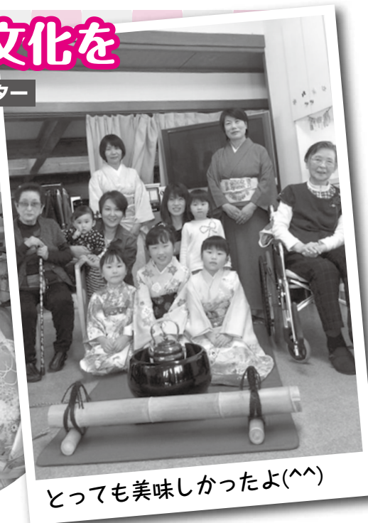
とっても美味しかったよ(^^)

松岡小学校の児童3名が、永平寺デイサービスセンターにおいてになり、ご利用様に抹茶の振る舞いをしてくださいました。抹茶の振る舞いの素晴らしさはもちろん、「家族のつながり」を実感できたひと時となりました。 というのも、振る舞いをしてくれた児童のひいおばあちゃんが永平寺デイサービスセンターのご利用者様でした。なんとという偶然! 世代を超え、なおかつ「お茶」という日本文化を通じての交流。 受け継がれていく伝統。ご利用者様もお抹茶とお菓子の味に舌鼓を打たれていました。