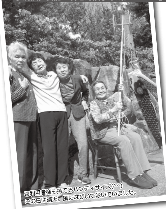
ご利用者様も持てるハンディサイズ(^^) この日は晴天。風になびいて泳いでいました。