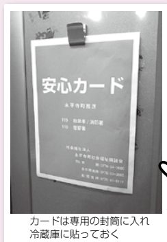
カードは専用の封筒に入れ冷蔵庫に貼っておく