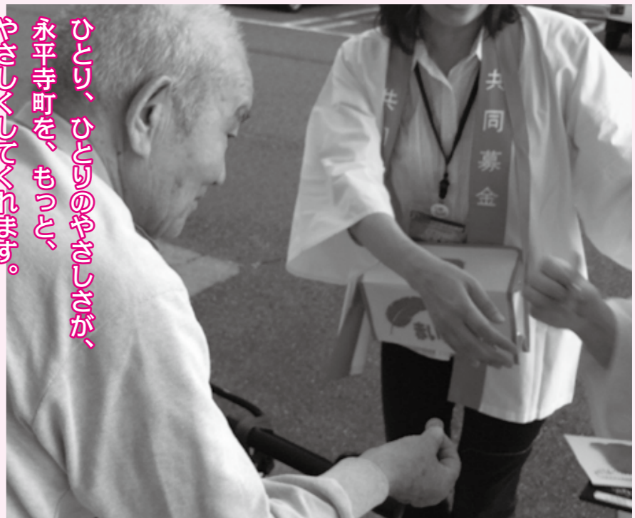
▲共同募金メイト前。みなさま、やさしさをありがとうございます。

「形」にする、そんな募金であらいたい。 みなさんのやさしさを、 募金も、なまねな形がほびます。 永平寺町をよくするため。 それは、 街頭募金で声を伝えたり 皆さんのおきにお願ひしたり 共同募金を支えています。 たくさんの町民のみなさんのやさしさを たくさん集めています。 やさしくしてくれませんか。 永平寺町を、もっと、 ひろく、ひろくつなげたい。