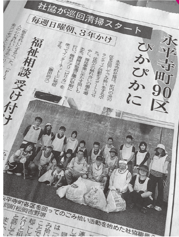
平成26年10月10日付福井新聞掲載

永平寺町社会福祉協議会 ☎64-3000 松岡事務所 ☎61-0111 永平寺事務所 ☎63-3868