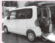
介護タクシーも 10月中旬より運行開始予定