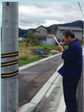
看板設置のために 電柱の調査!