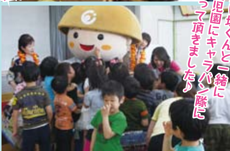
えい坊くんと一緒に 幼稚園にキャラバン隊に 行って頂きました。

今年も多くのボランティアの方に、ふれ愛フェスタ ALOHA 2014に向けたボランティアとしてお集まりいただき、腕を振るって頂きました。