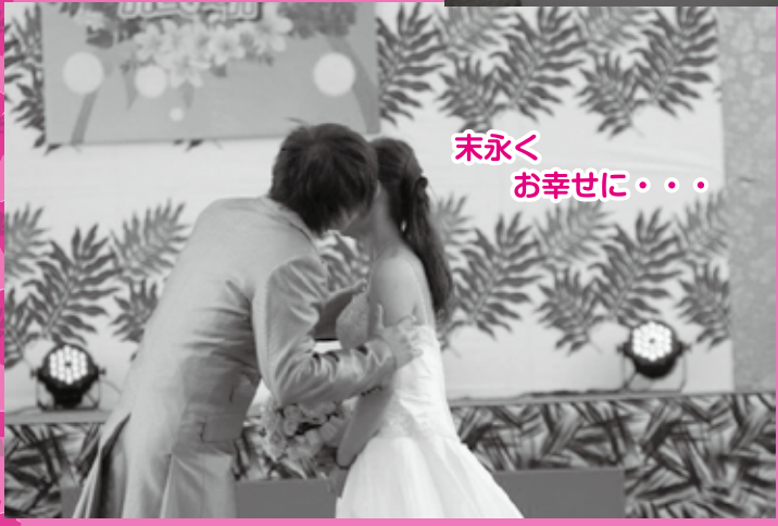
末永くお幸せに・・・