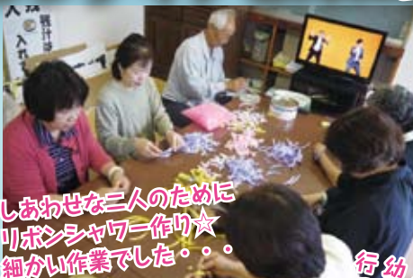
しおわせな二人のために 叩ボシチャワーク作り☆ 細かい作業でした。。。