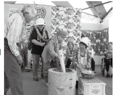
写真はふれあいフェスタ ALOHA2013 米寿の祝い餅つきの様子