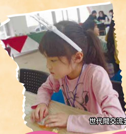
世代間交流会での一コマ