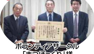
ボランティアサークル「まつぼっくり」様

ボランティアサークルまつぼっくり様は、これまで、特別養護老人ホーム、障がい者施設等でレクリエーション活動や町内高齢者運動会の企画・運営をされ、また、災害支援活動ボランティアもされるなど多岐にわたり長年活動されてきました。これらの功績に対して今回の受賞となりました。