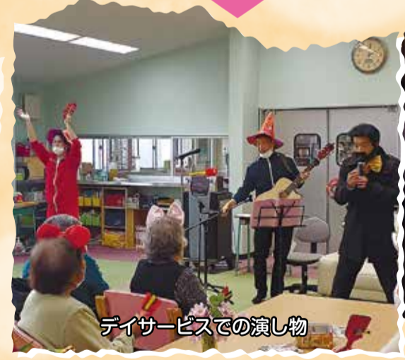
デイサービスでの演し物