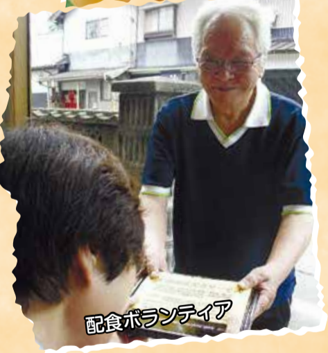
配食ボランティア