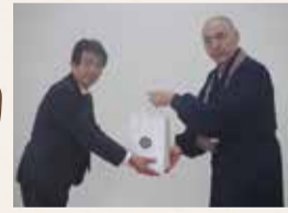
大本山永平寺様からの贈呈の様子