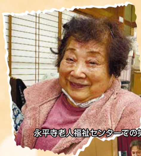
永平寺老人福祉センターでの笑顔