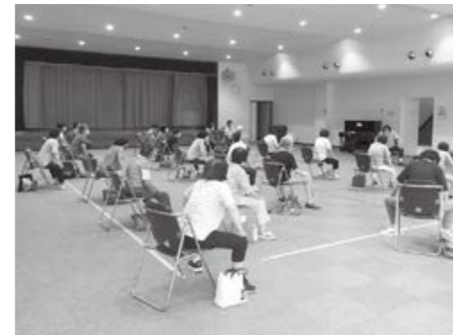
開発センターの筋トレ教室の様子