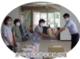
トヨタモビリティパーツ株式会社様