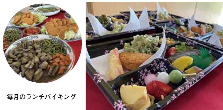
毎月のランチバイキング