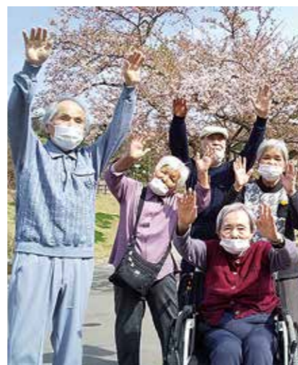
晴れた日には外で日向ぼっこ♪