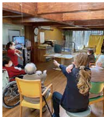
映像を使用した機能訓練

永平寺デイサービスセンターは毎月ランチバイキングを開催。時には御膳のような昼食もあります。おやつも手作りがウリで、魅力のひとつとなっています。皆様にも永平寺デイサービスの、見て楽しく、食べておいしい昼食やおやつを堪能していただきたいと思います。