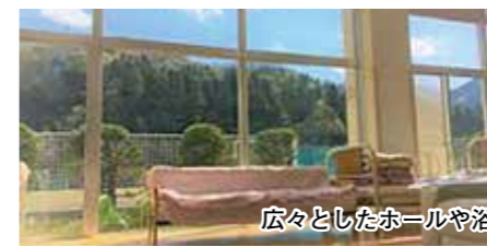
広々としたホールや浴室から見える景色