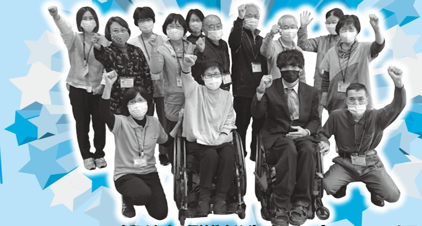
令和4年度 福祉教育サポーターメンバー

小学校や地域に置いて、福祉教育を行う際に「車いす体験」「アイマスク体験」「高齢者疑似体験」等のお手伝いをします。