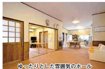
ゆったりとした雰囲気のホール

日常の風景に溶け込む小さな民家風の「ほっこり」は少人数で家庭的な雰囲気です。手作りの昼食やゆったりとした時間を過ごすだけでなく、外へでて散歩したり、地域の方との交流を楽しめる機会があることも魅力のひとつとなっています。