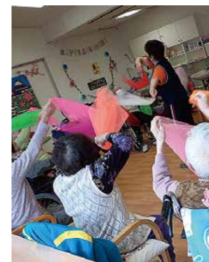
みんな楽しく体操中♪

さらに利用者様と一緒に施設を飾り付けして、ワクワクする空間を一緒につくっています。