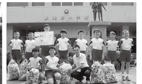
10月5日 上志比小学校様