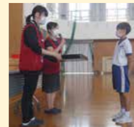
↑一人ずつ任命状を受け取りました!

↑5年生の先輩から今年の「御陵きらきら探検隊」へ思いのこもったピブスの受け渡し。期待に胸を膨らみます(^ ^)