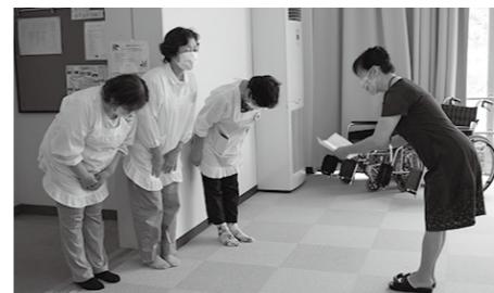
9月24・28・29日 永平寺町赤十字奉仕団様 雑巾づくり(永寿苑の利用者の皆様)