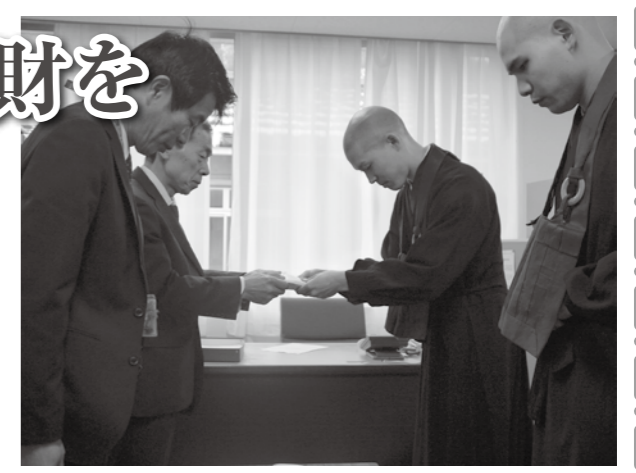
頂いた浄財は町の福祉のために有効に活用させていただきます。

毎年、歳末の時期に町の福祉のために寄附を頂いており、今年は303,254円の浄財を頂きました。